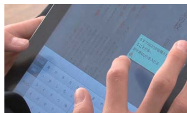
写真3：本時の学びを付箋に記入し記録する