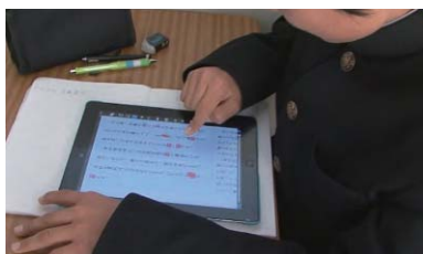
写真1：朗読機能を使用し、音読を支援する