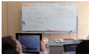
写真2：板書を撮影し、復習に使う