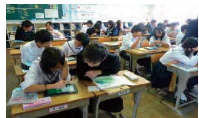
写真3：ペア学習の全体の様子