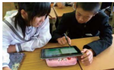
写真2：ペアで問題を出し合う