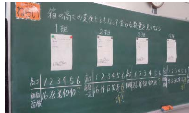
写真3: 生徒が計算した結果から特徴を読み取る板書