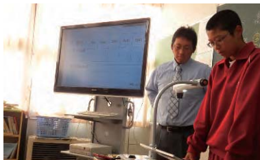
写真2: まとめ用紙を拡大して全体に発表する