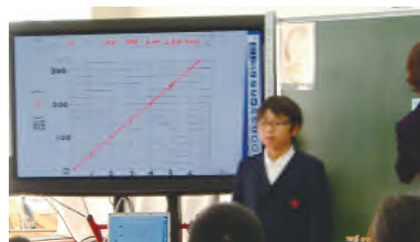
写真2: グループでかいたグラフを取り込み根拠を示しながら説明