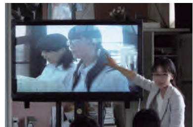
写真3: ビデオ撮影後の視聴と成果・課題の発表及び教師の評価