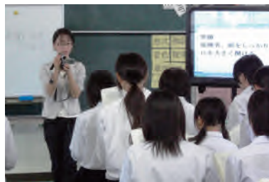
写真2: 動画視聴を生かしての合唱とビデオ撮影