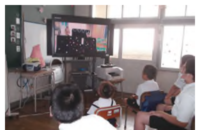
写真3: 教師が撮影の児童の劇をみなで見て振り返る