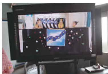
写真2: 教師が撮影の児童の劇を電子黒板に映す