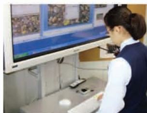
デジタルカメラで撮影した写真に俳句を入力