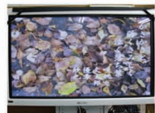
自作の写真俳句作品を全員の前で発表