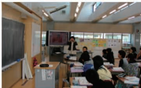
じゃがいもを使ったおかずについて児童が前に出て発表