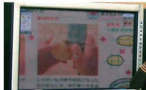
教科書の写真を拡大し、児童が写真に線を入れたり、芽の部分をペンタッチで強調しながら発表する