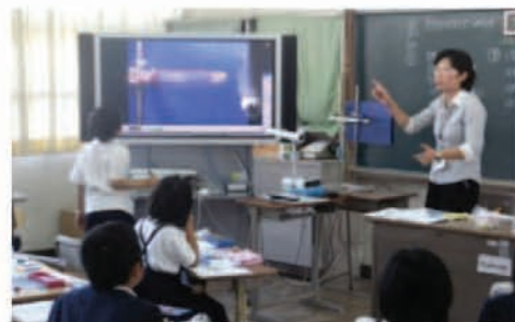
実際に玉を飛ばした映像を繰り返し見て、考えを深める