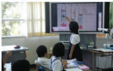
自分のまとめたことを画面に提示して説明する。友だちの考えに対する補足や反論も、電子黒板上に書き込みながら行う