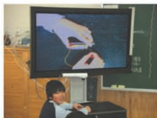
児童の手元を拡大提示し、つなぎ方を確認