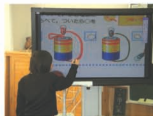
ノートを取り込み、電流を書き込みながら説明