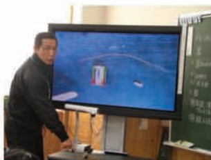
本時に使う実験道具を拡大提示