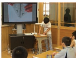
三角定規を操作している手元を拡大表示