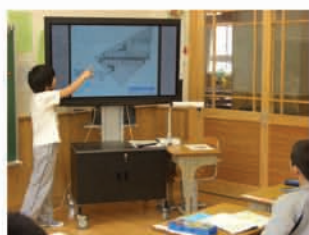
実物を提示しながらの説明