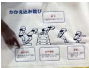
技のポイントを基礎基本ボードで提示し、技能ポイントを押さえる