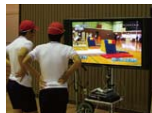
実際の演技を視聴して、自分の動きの確認や友達のアドバイスを行う