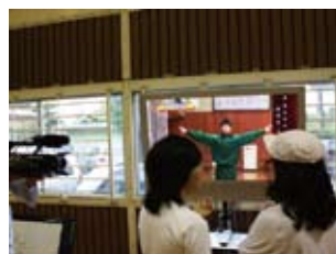
自分の見たい技の模範演技動画を視聴する