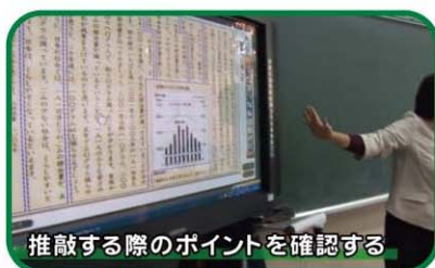
【小学校5年・国語】 グラフや表を引用して書こう