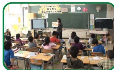
【小学校2年・国語】 がまくんかえるくん「友だちかるた」を作ろう

この映像集では、ICTの活用場面や活用意図が具体的に分かるよう、実際の授業でのICT活用場面を描くとともに、授業者にその活用効果について語っていただいています。