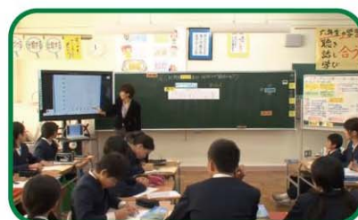
【小学校6年・算数】 比例と反比例