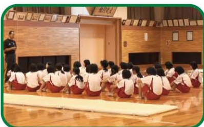
【中学校1年・体育】 マット運動