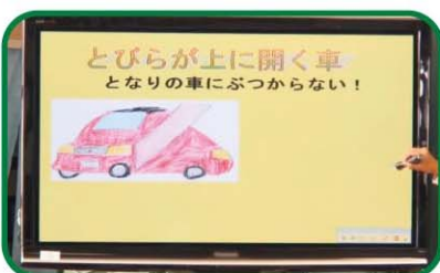
【小学校5年・社会】 自動車工場をたずねて