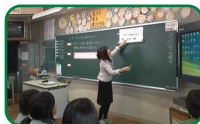
【小学校6年・外国語活動】 Lesson8 オリジナルの劇を作ろう