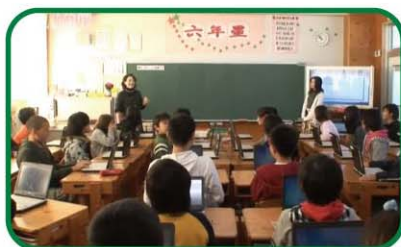
【小学校6年・総合的な学習の時間】 真志っ子ショップを開こう