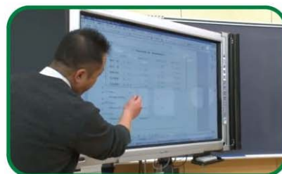
【中学校2年・英語】 NEW TREASURE STAGE2 Lesson4-1

こちらから研究成果にアクセスできます ➡ http://www.eduict.jp/