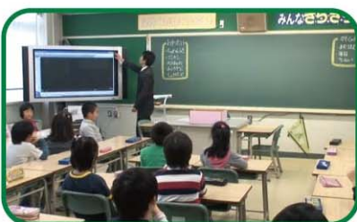
【小学校2年・道徳】 はたらくっていいね